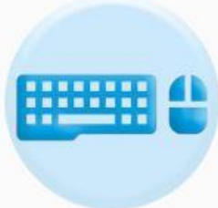
КЛАВИАТУРА ОРГТЕХНИКИ И МЫШКА