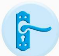
РУЧКИ ДВЕРЕЙ И ШКАФОВ

ТО, К ЧЕМУ МЫ ПРИКАСАЕМСЯ ЧАЩЕ ВСЕГО ДОЛЖНО БЫТЬ ЧИСТЫМ