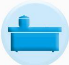
ПОВЕРХНОСТИ СТОЛЕШНИЦ, ПОЛОК