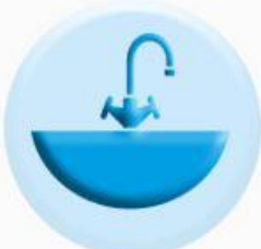
РАКОВИНЫ И СМЕСИТЕЛИ