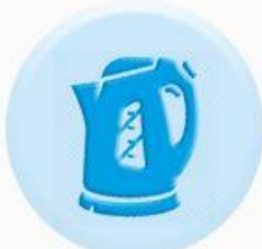
КНОПКИ БЫТОВЫХ ПРИБОРОВ