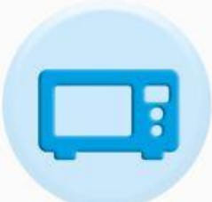
ПАНЕЛИ БЫТОВОЙ ТЕХНИКИ